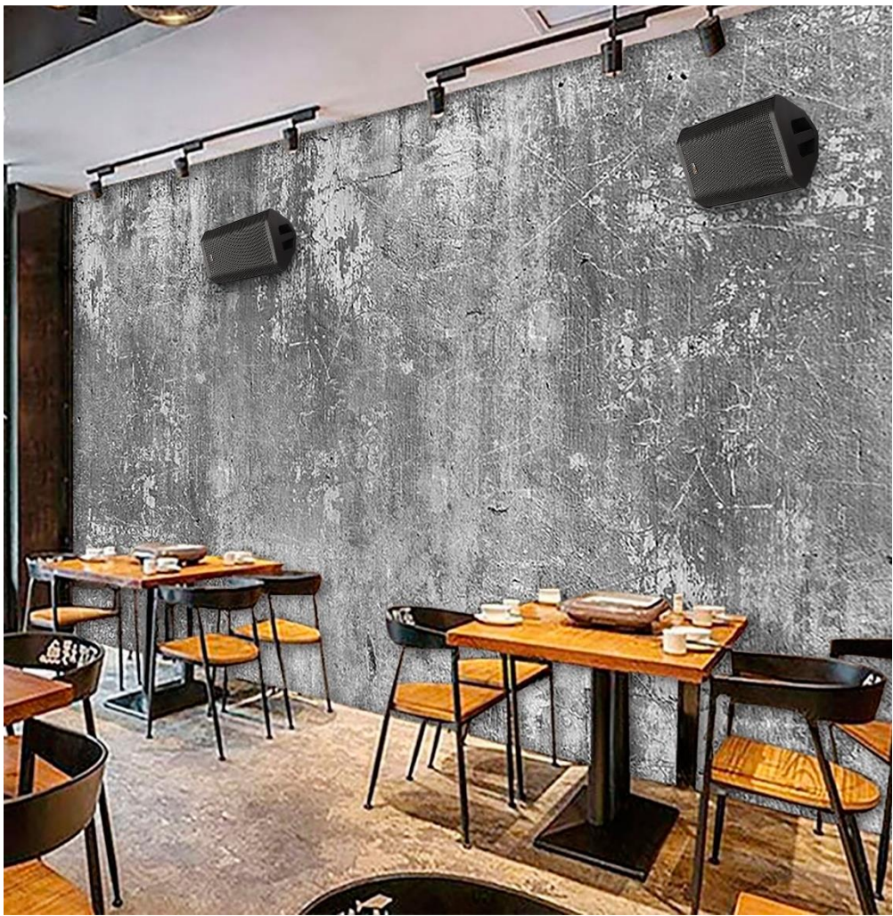
Soporte para la instalación en pared o techo