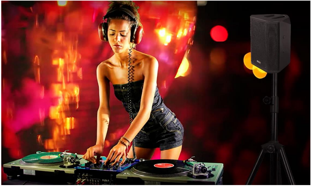
Soporte de altavoz